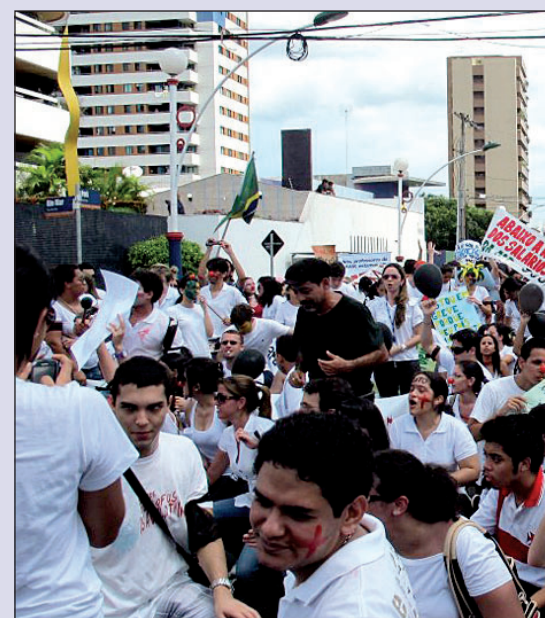
Estudantes do curso de Medicina realizam

Há sete anos, os docentes não fazem greve. Mais que a busca por melhores salários, os educadores lutam pela Reestruturação da Carreira Docente, além da melhoria na qualidade do ensino público no Brasil. Especificamente na Ufam, os professores denunciam a falta estrutura física, como laboratórios, bibliotecas, salas de aulas e até mesmo material básico de higiene. Essa situação chega a ser mais agravante nos cinco campi do interior do Estado - Itacoatiara, Coari, Humaitá, Benjamin Constant e Parintins.