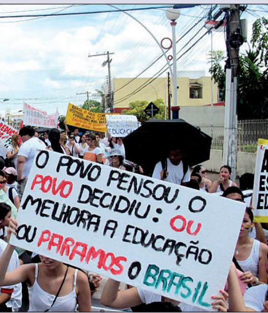
aram uma passeata nas ruas da cidade