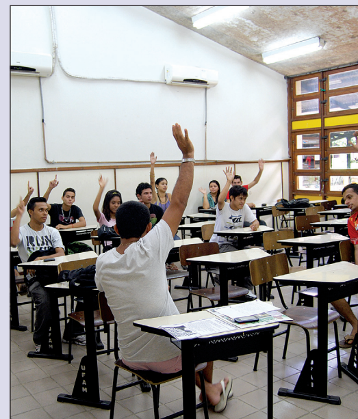
O Comando de Greve Estudantil também

“Foi um momento histórico, porque o curso de Medicina é o último a entrar na greve e o primeiro a sair. Dessa vez foi diferente, sobretudo porque estamos insatisfeitos devido à falta de estrutura na faculdade como laboratórios deficientes e até falta de gaze para os atendimentos de aula prática no HUGV”, disse o diretor-executivo do centro Acadêmico de Medicina Humberto Men-