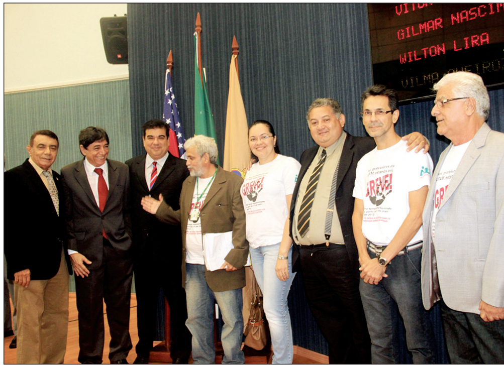
Integrantes do Comando Local de Greve defenderam as reivindicações dos docentes na Câmara Municipal de Manaus e Assembleia Legislativa do AM

Entre as atividades prevista no calendário de greve estavam às visitas do CLG nas casas legislativas do Amazonas, com objetivo de conquistar o apoio dos parlamentares da capital na defesa da universidade pública, gratuita e socialmente referenciada. No dia 30 de maio, integrantes do movimento paredista participaram da “Tribuna Popular”, na Câmara Municipal de Manaus (CMM) e, no dia 31, repetiram a ação no plenário da Assembleia Legislativa do Estado do Amazonas (Aleam).