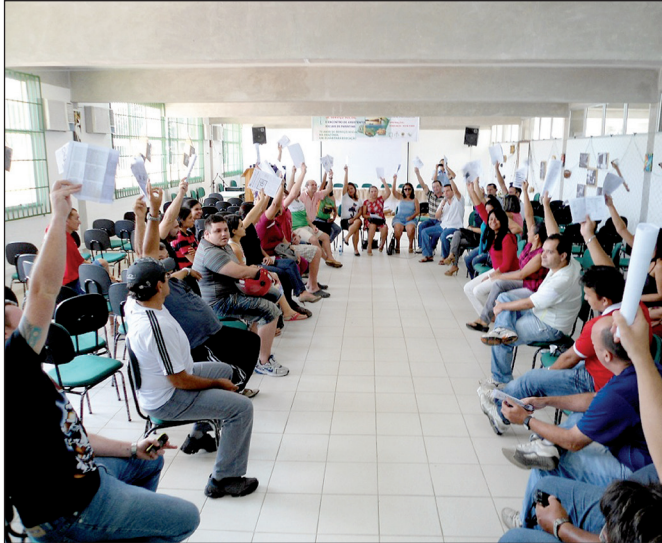
Greve no interior foi decidida em assembleia