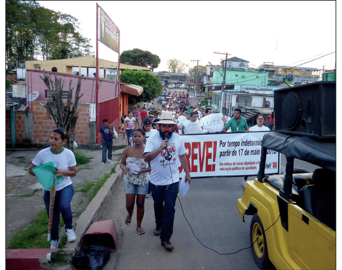
Em Coari, uma das atividades foi a passeata