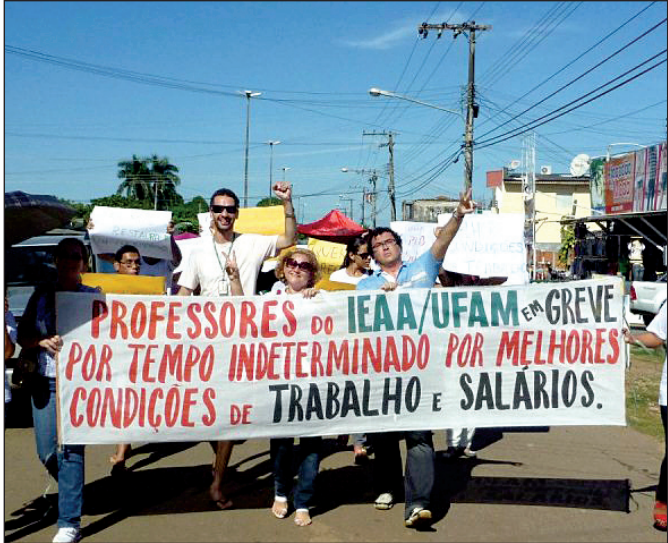
Em Humaitá, docentes protestaram nas ruas